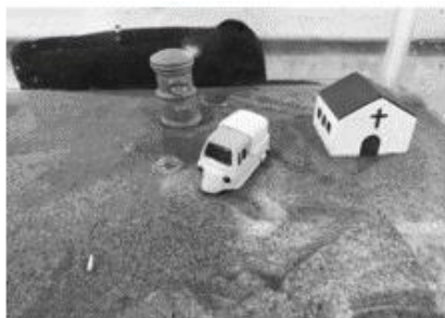
振動を加えると重いものが沈み始めました。